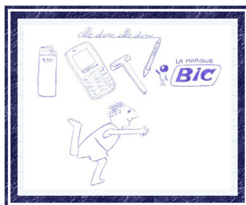
« BIC story » réalisé par Managua, a été l'œuvre préférée des internautes